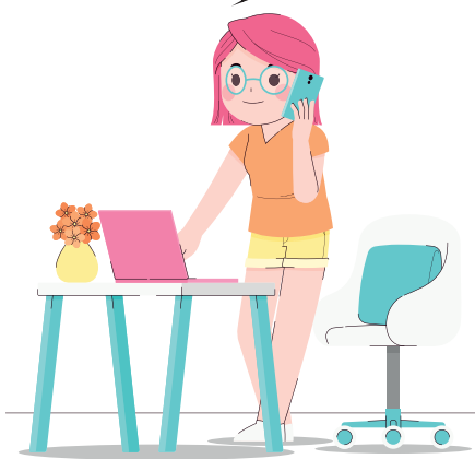
Se comunica con el ciudadano una vez este lista la respuesta al escrito