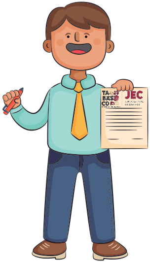
El ciudadano viene por su respuesta a la dependencia