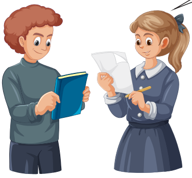
Se recibe el escrito del ciudadano

¡Buen día! Con gusto le recibo su escrito