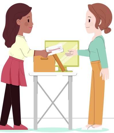
Se canaliza al área correspondiente para seguimiento y respuesta